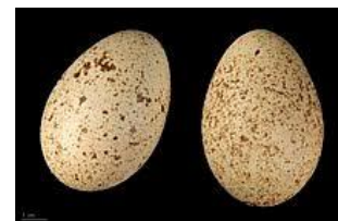
Œufs de lophophore