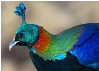
Mâle lophophore (crête)

L'animal utilise différents cris pour différentes fonctions : un cri d'alarme, un cri territorial un cri d'anxiété émis par le mâle afin de prévenir les autres individus si une éventuelle situation de danger se présente. Le cri du mâle est un sifflement aigu et strident. Celui des juvéniles est encore plus aigu et celui de la femelle est similaire à celui du mâle.