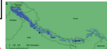
Les points bleus correspondent aux nombres d'individus répertoriés sur la chaîne himalayenne