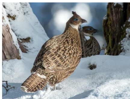
Poule de lophophore