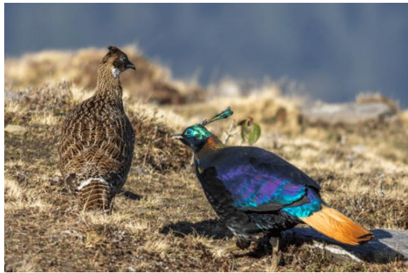
Couple de lophophores