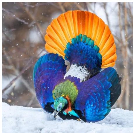
Parade de lophophore